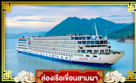
🚢 ล่องเรือเขื่อนสามผา