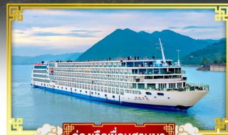
ล่องเรือเขื่อนสามผา