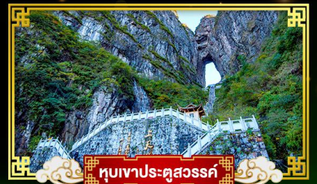
🗿 ทุบเขาประตูสวรรค์