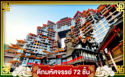
🏯 ตึกมหัศจรรย์ 72 ชั้น